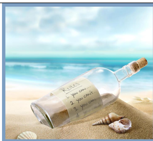
Elisabetta Meda for fair use. 1