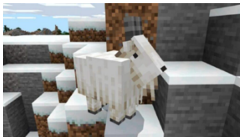
La nuova capra di montagna tra le nevi!

Utilizzate per illuminare, possono essere di colori differenti. Sono utili anche per indicare un'area antica.