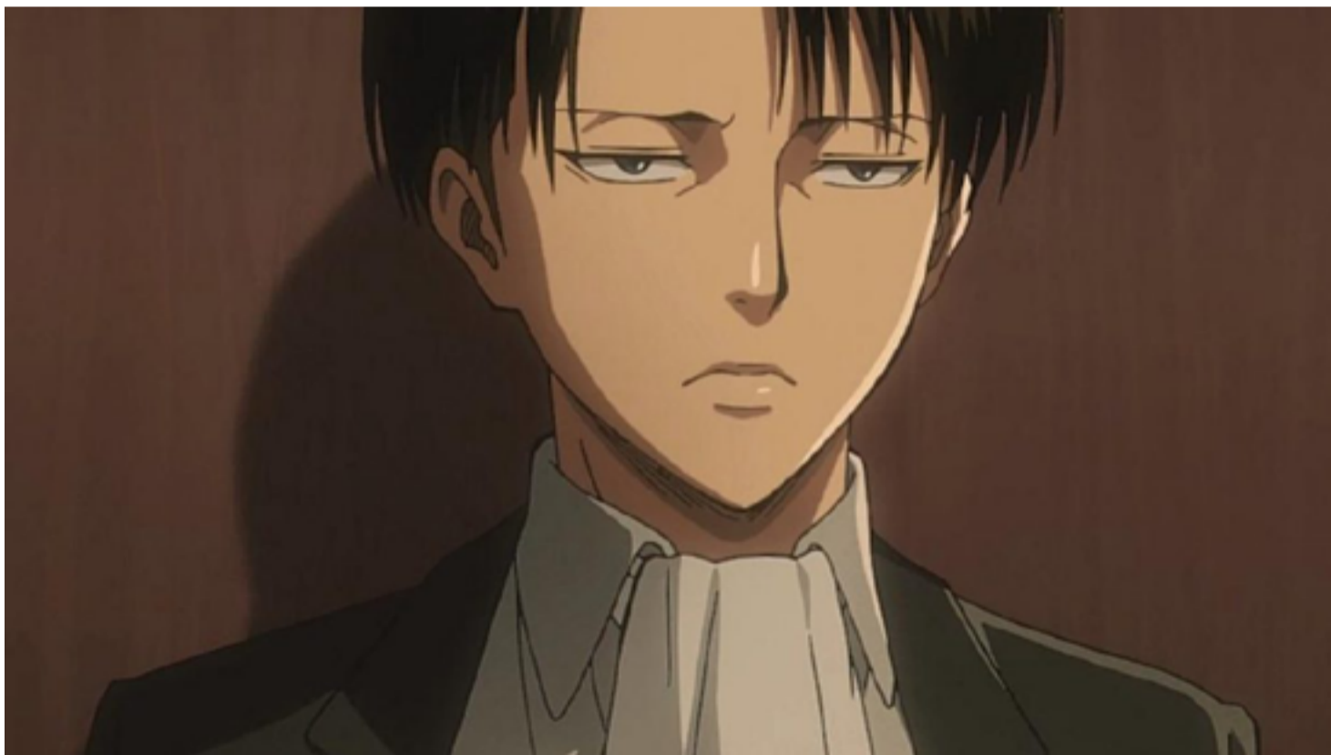
Levi Ackerman in una scena della terza stagione di Attack on Titan