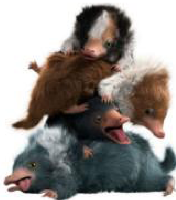
Un esempio di Snasi dai diversi colori.

Gli Snasi possono essere di vari colori, come marroni e bianchi; neri bianchi e marroni; grigio molto scuro; bianchi e grigio-blu.