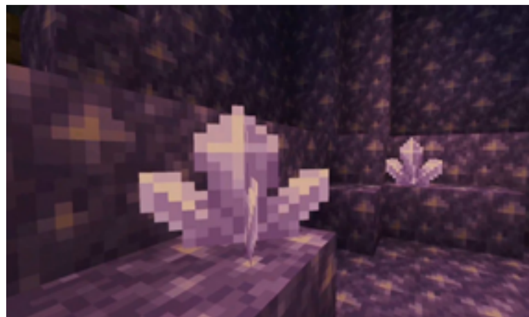
Una grotta di ametista.

La spazzola servirà per trovare oggetti nascosti nella ghiaia.