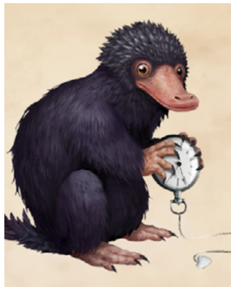
Un esemplare di Snaso.

ha una caratteristica molto particolare: l'ossessione di prendere tutto ciò che brilla! Lo Snaso è caratterizzato da una folta pelliccia e da un lungo muso, è un animale sotterraneo che vive a sei metri sottoterra e dà alla luce dai sei agli otto cuccioli alla volta. I loro occhi sono neri e piccoli ed è stata accertata la loro quasi cecità, dato che trascorrono gran parte della loro vita nei loro tunnel sotterranei. Queste creature si nutrono prevalentemente di animali invertebrati come lombrichi, formiche, lumache e tutti gli animali di piccole dimensioni che vivono nella terra. Sono molto innocui, tranne quando avvertono la presenza di oro: per ottenere gli oggetti che tanto li attraggono sono disposti a ferire e a mordere!