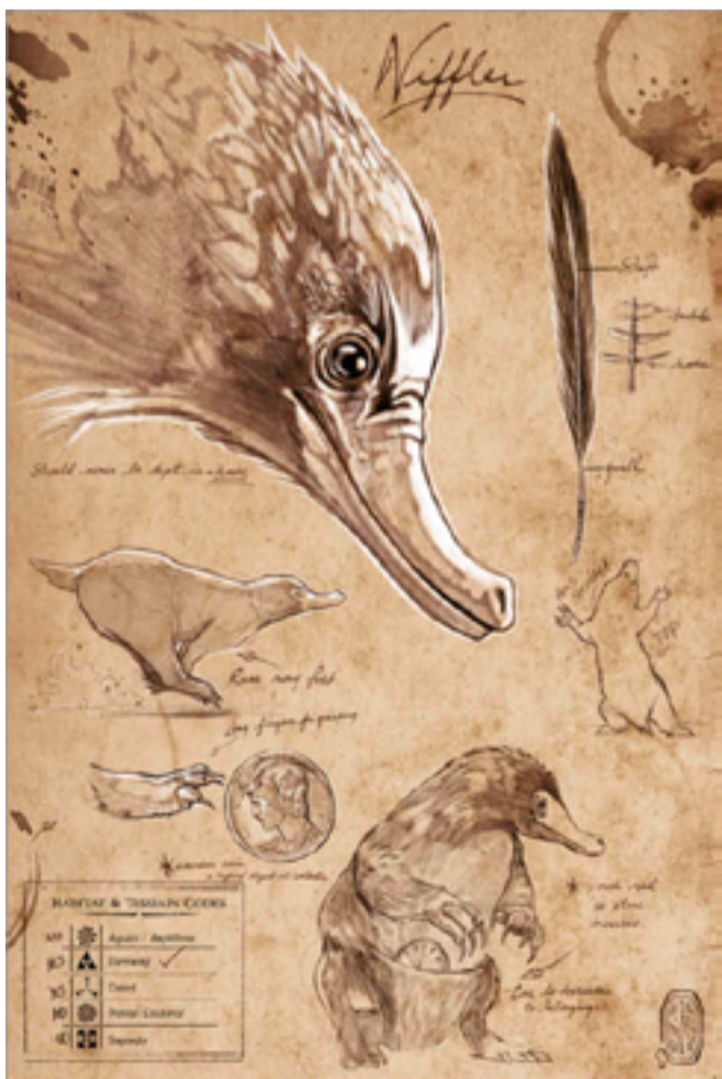
Tavola preparatoria dei disegni dello Snaso.

Il nome di questa simpatica creatura, originariamente, era “niffler”, dal verbo inglese “to niffle”, che significa sgraffignare. Lo Snaso è una delle mie creature magiche preferite poichè