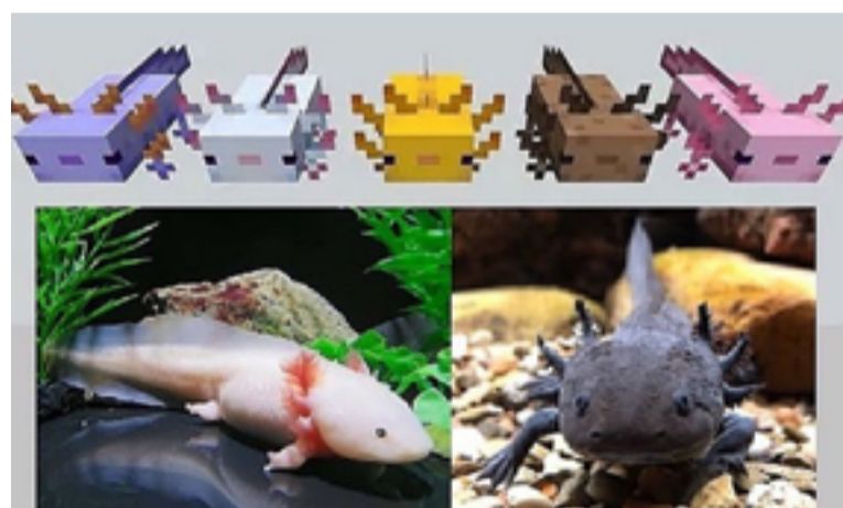
L'Axolotl, in natura, è una specie di salamandra che vive in Messico.