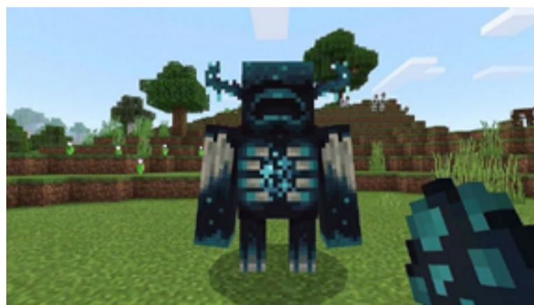
Un nuovo mostro: il Warden!