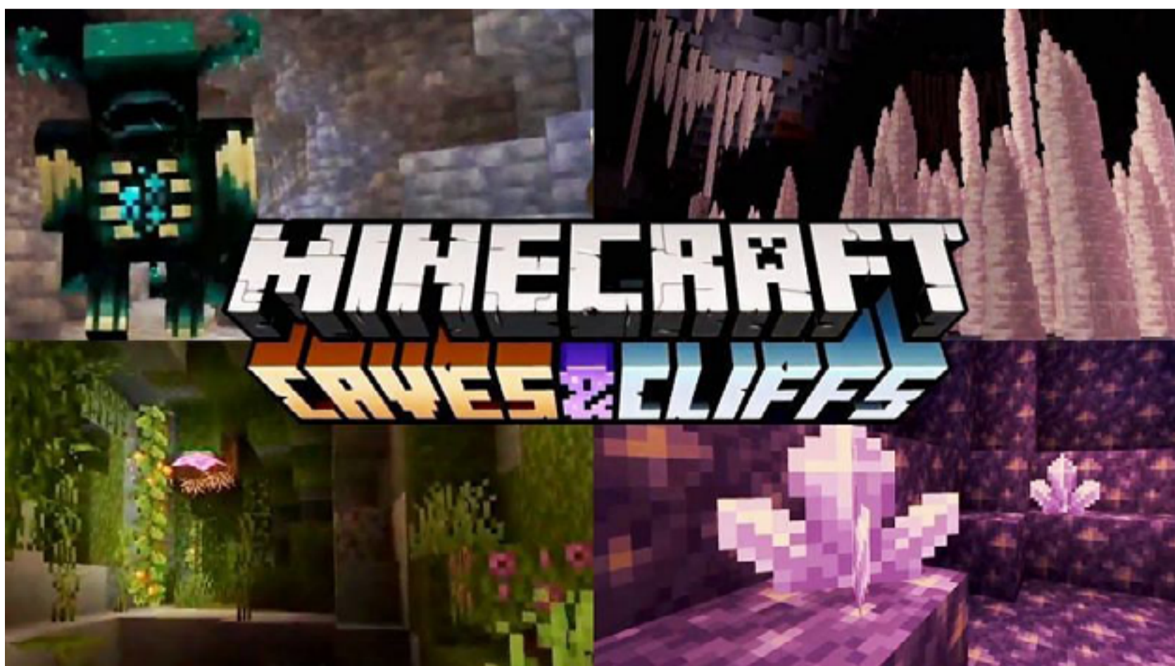
Questo nuovo aggiornamento si chiamerà: "Minecraft Caves & Cliffs"!