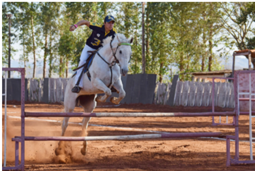
Un esempio di cavaliere intento a saltare un ostacolo in sella al suo cavallo.