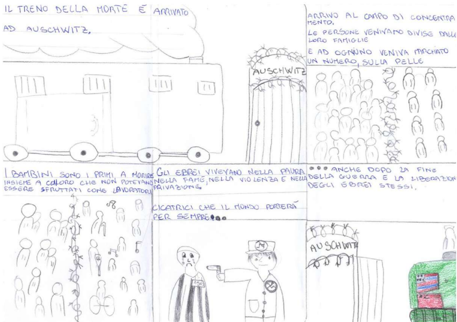
VIGNETTA A CURA DI NARJESSE ED ELENA

Meditiamo, riflettiamo e soprattutto, non dimentichiamo.